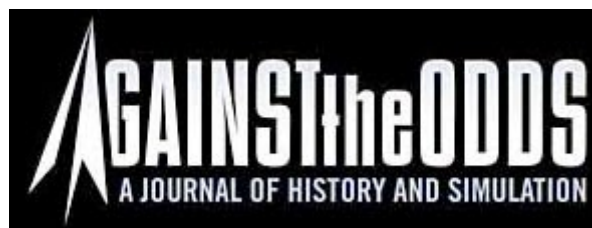
Against the Odds Magazine