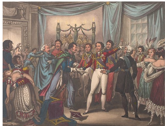
Un officier prussien informe Wellington de l'arrivée des troupes françaises à Charleroi. (Allégorie de William Heath, 1816)