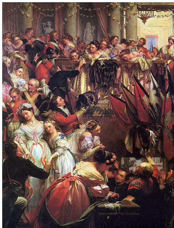
Les adieux des officiers. Allégorie de Henry-Nelson-O'Neil (1868).