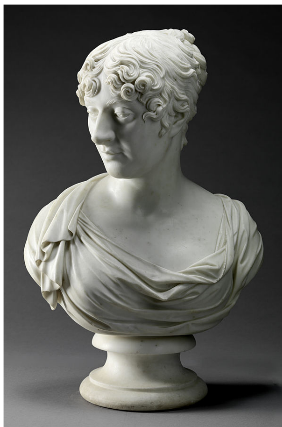
Charlotte, Duchesse de Richmond (1768–1842) (J. Nollekens, 1812)

Une invitation fut envoyée aux deux cents quinze personnes dont le nom suit [6] :