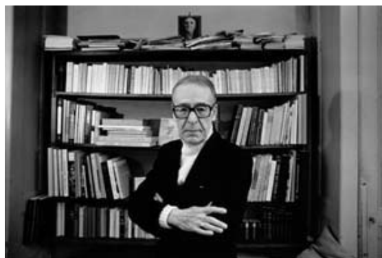
Henri Guillemin en 1980

Henri Guillemin est avant tout un spécialiste du XIX e